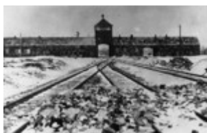
[važiavimo į KL Auschwitz-Birkenau vartai; 1945 m. sausis (IPN)