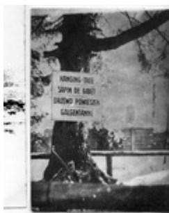
KL Stutthof – eglė, ant kurios kardavo kalinius; antra ketvirtojo dešimtmečio pusė (IPN)