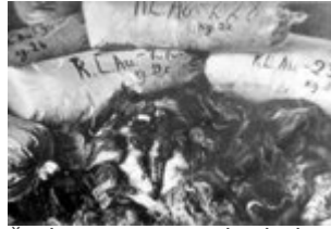
Krūvos maišų su KL Auschwitz-Birkenau nužudytų moterų plaukais. Vokiečiai plaukus supakavo ir paruošė išsiųsti, kad galėtų panaudoti pramonėje; 1945 m. po stovyklos išlaisvinimo