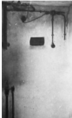
KL Majdanek – patalpa prieš dujų kamerą su dujų buteliu ir įjungimo prietaisu. Langelis sienoje leido stebėti nuodijimo procesą (IPN)