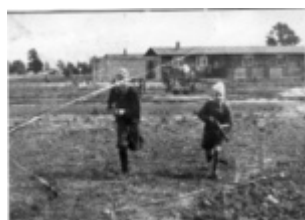
Vyriausieji Makso Paulio (Max Pauly), KL Stutthof komendanto, sūnūs žaidžia stovyklos teritorijoje; greičiausiai 1942 m.