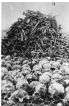
KL Majdanek – aukų kaukolės ir kaulai, iškasti ekshumacijos metu; 1944 m. ruduo (IPN)