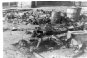
Laikinoji stovykla Žabikove prie Poznanės - evakuojant stovyklą sušaudytų ir sudegintų kalinių kūnai; 1945 m. sausis po stovyklos išlaisvinimo