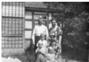
Maksas Paulis, KL Stutthof komendantas, su žmona ir vaikais priešais namą Gdanske; tarp 1939 ir 1942 m.