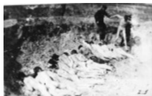
Masinė egzekucija KL Stutthof (IPN)