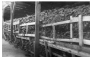
KL Majdanek – apavo stirtos viename iš barakų; 1944 m. liepa po stovyklos išlaisvinimo