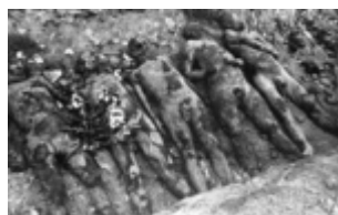
KL Majdanek – atkasti kalinių palaikai; 1944 m. Rugsjūtis (IPN)