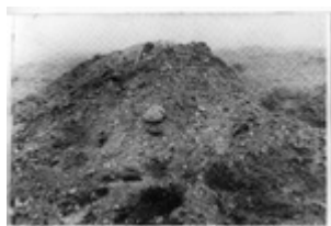
Pelenų iš krematorijaus krūva Treblinkos naikinimo stovyklos teritorijoje (IPN)