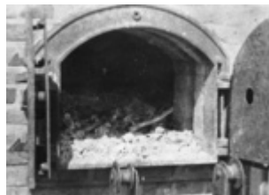
KL Majdanek po išlaisvinimo 1944 m. Krematorijaus krosnies vidus su sudegintų žmonių liekanomis (IPN).