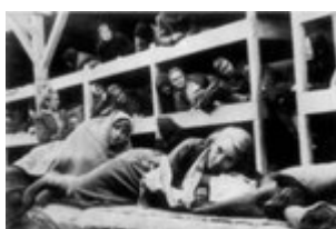
KL Auschwitz-Birkenau - kalinės barake; 1945 m. (IPN)