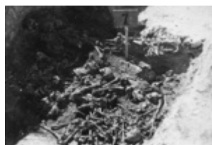
Vienas iš ekshumacijos metu atvertų karstų KL Majdanek; 1944 m. ruduo (IPN)