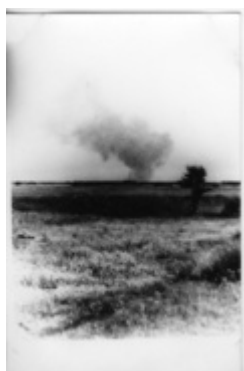
Treblinkos naikinimo stovykla - tolumoje virš stovyklos matyti dūmai (IPN)