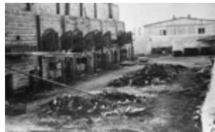
KL Majdanek – suanglėjusių palaikų dalys prie krematorijaus krosnių; 1944 m. liepa po stovyklos išlaisvinimo (IPN)